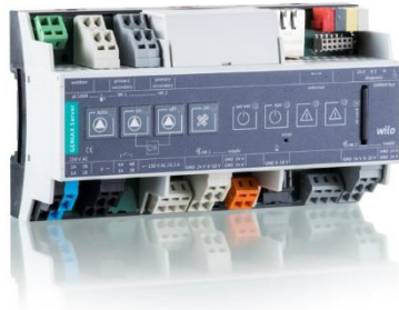
Empur: Geniax Server: Anschlussfertige Regel- und Steuereinheit. Zentrale Intelligenz des Geniax-Systems.